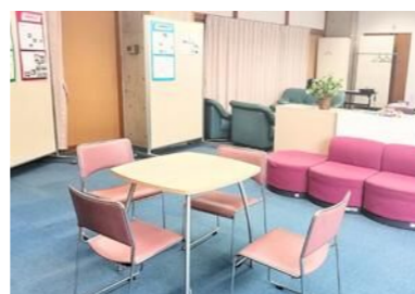
校内適応指導教室（校内ステップルーム） 集団スペース ↑

ご家庭の状況に合わせて連携します。話し合いを重ねて連絡や訪問の頻度、方法を調整します。