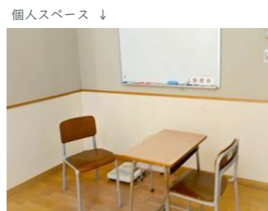
個人スペース ↓ ※ 校内適応指導教室（校内ステップルーム）は一部の中学校に設置されています。

学校にどんなことを相談したらいいの？と迷ったら、「おはなしの種シート」をご活用ください。