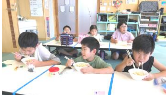
うどんつつる♪おいしいな♪