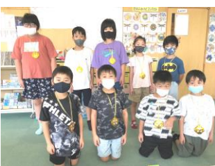
折り紙チャレンジ 全制覇の金メダリスト達☆