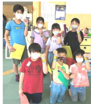
100首おぼえた7人! がんばったね!すごい!