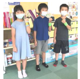
五色百人一首大会 真剣勝負!