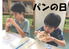
注文したパンをみんなで食べました☆