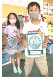
めりえコンテスト