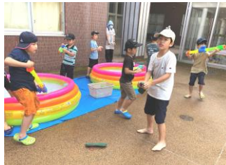
楽しかったね♪水遊び♪